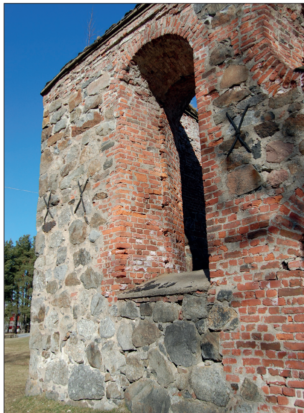
F.d. Mustasaari sockenkyrka är i dag en del av Gamla Vasa ruiner.

Pedersöre och Närpes vet vi ju var de finns i dag, och de kyrkorna har också funnits på samma ställe sedan medeltiden. I dag kan man alltså gå in i kyrkorna och se delar av byggnaderna som finns kvar sedan dess. Hur var det då med Mustasaari? I dag är ju Mustasaari det finska namnet på Korsholms kommun, men så var det inte på medeltiden. Ända fram till år 1927 användes namnet Korsholm enbart för området kring Korsholms vallar utanför Gamla Vasa. Där låg Korsholms slott och senare Korsholms kungsgård. För de områden som administre-