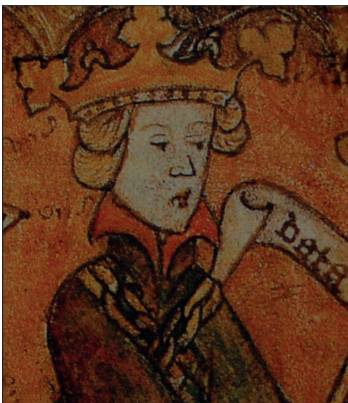
Kung Magnus Eriksson av Sverige, som instiftade Österbottens första officiella marknadsplatser. Bilden kommer från pärmen på Magnus Erikssons landslag, ca 1350.

Kung Magnus hade i sin tur en komplicerad relation till sin son Håkan, som tidigt valdes till kung i Norge. Emellanåt krigade far och son