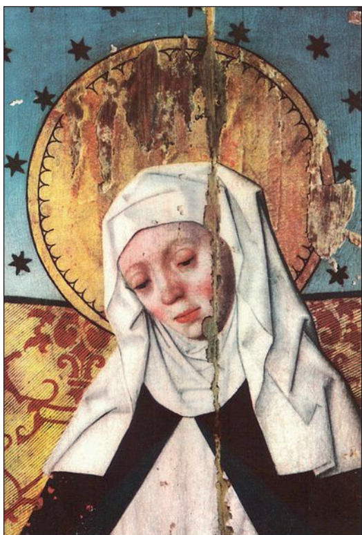
Heliga Birgitta, målning på altarskåp i Salem kyrka, Södermanland.